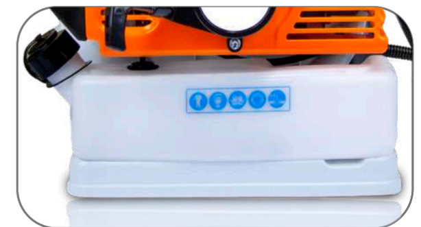
TANQUE DE GASOLINA