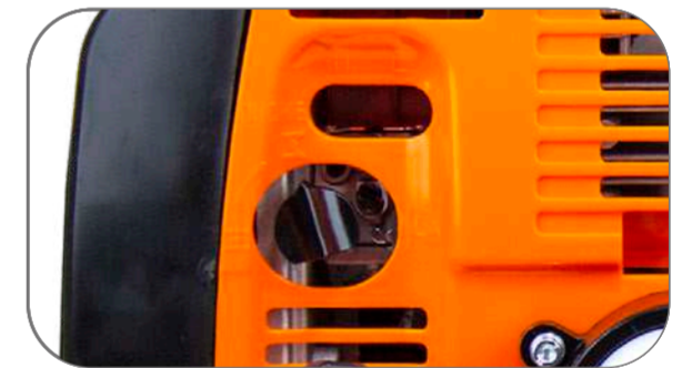
PASE DE GASOLINA